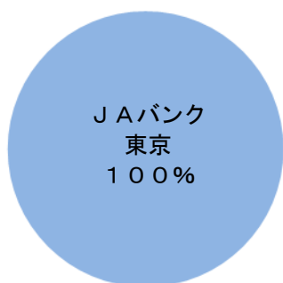
農業近代化資金取扱いシェア (平成27年3月末時点)